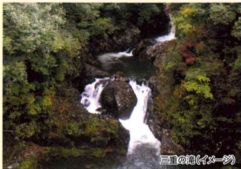
三重の滝(イメージ)

●抽選のため、1名ずつの申し込みとなります。(2名でお申し込みいただいても、1名は当選、1名は落選の可能性がございます) ●申込締切/11月19日(金)必着 ●当選のご連絡/11月22日(月)まで 落選の方への連絡はございませんが、キャンセル待ちとさせていただきます。 ●18歳以上のお申し込みに限ります。 ●アンケートのお願い/モニターツアーに参加の皆様はアンケートのご協力をお願いしております。