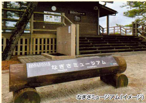
なぎさミュージアム(イメージ)