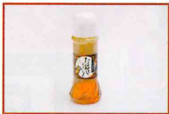
●玉ねぎドレッシング 300g