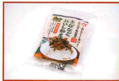
●きびなごおいし和え