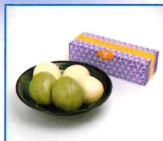
●かじきまんじゅう5個入り