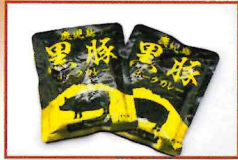
●黒豚ポークカレー×2個