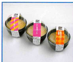
●かじはらプリン3点セット