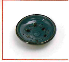
●龍門司焼 藍軸優羽花紋小皿