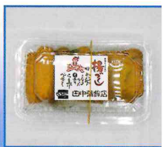
●さつまあげセット