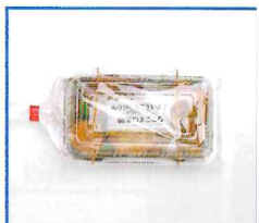
●無添加彩りさつま揚げ 5枚