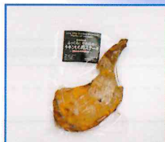
●やわらかチキンももステーキ