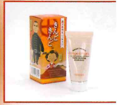
●鹿児島限定きんごきんご