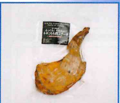
●やわらかチキンももステーキ