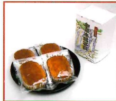
●小判ふくれ 4個入り