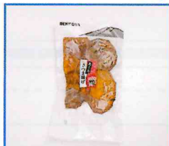
●真空ミックスさつま揚げ