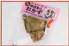
●桜島灰干し おかずぶり