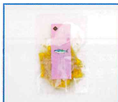
●燻製まぐろオリーブオイルフレーク