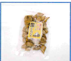
●ゆいちゃんの黒にんにく