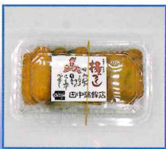
●さつまあげセット