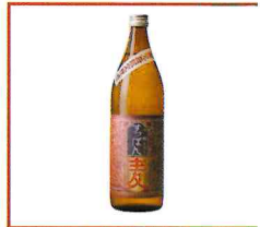
●始良市限定麦焼酎 すっぽん麦