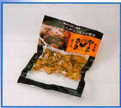
●こんがりコロコロ焼 (タレ味) 100g