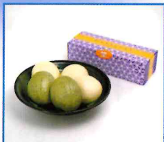
●かじきまんじゅう5個入り