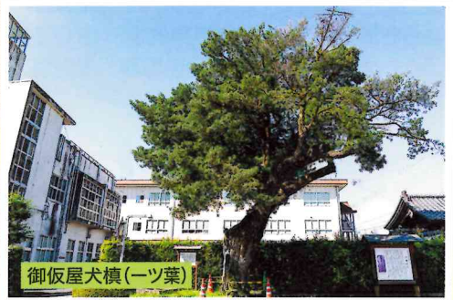
御仮屋犬榎(一ツ葉)