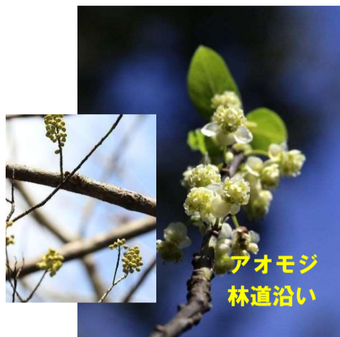
アオモジ 林道沿い

○例年より10日ほど早く咲いてます ・アオモジ ・キブシ ・アミガサユリ ・サツマイナモリ