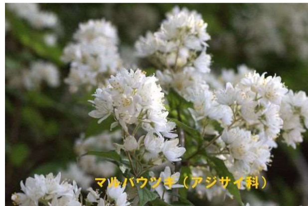
マツバウツギ (アジサイ科)