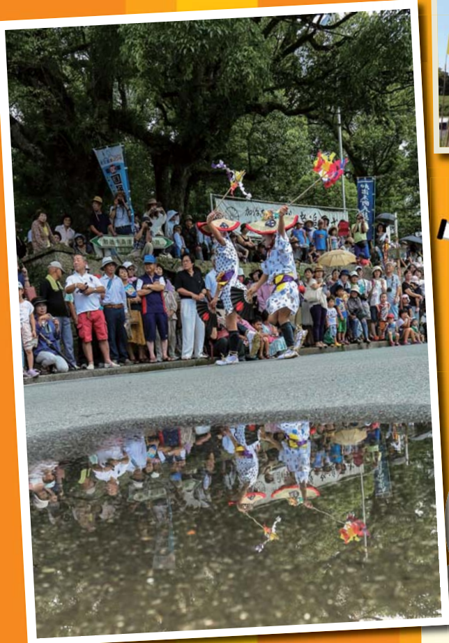
昨年度 最優秀賞 タイトル「世代を越えた太鼓踊り」